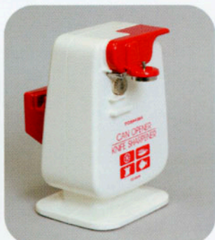
電気包丁とぎ付きカンオープナー CO-600K 東京芝浦電気製。昭和40年代。手前の側が缶切りになり、後ろは包丁研ぎになっている。 画像提供=東芝科学館

餅つき器 AFC-154 東京芝浦電気製。昭和49年(1974)。現在もさらに多機能化・小型化した新製品が出されている。画像提供=東芝科学館