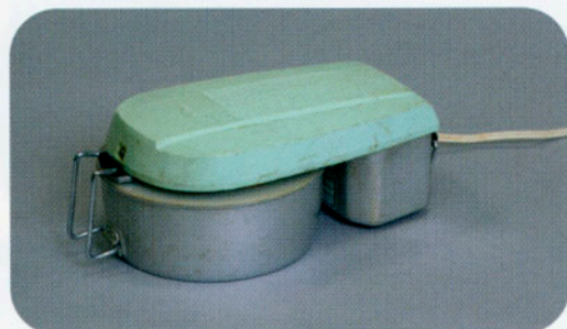
アイスクリームフリーザー TIF-4 東京芝浦電気製。家庭でもアイスクリームが作れるようになった。