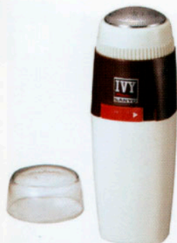
電気かみそり SV-1 三洋電機製。昭和39年(1964)。やはりアイビー調の電池式かみそり。 画像提供=三洋電機社史資料室

ヘアードライヤーHD-11 三洋電機製。昭和39年(1964)。 アメリカ東部の有名大学(アイビーリーグ)の学生ファッションが流行。若者向けアイビー調の家電が売り出された。 画像提供=三洋電機社史資料室